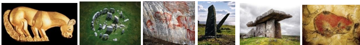
Первобытная живопись в пещере Альтамира Первобытная живопись в Каповой пещере

Соотнести изображения с названиями или определениями